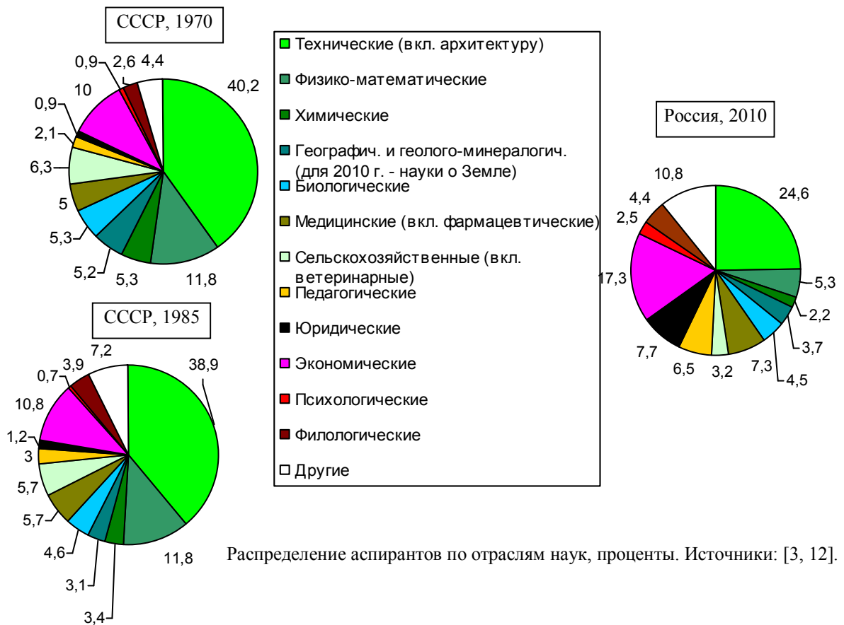
Распределение аспирантов по отраслям наук, проценты. Источники: [3, 12].